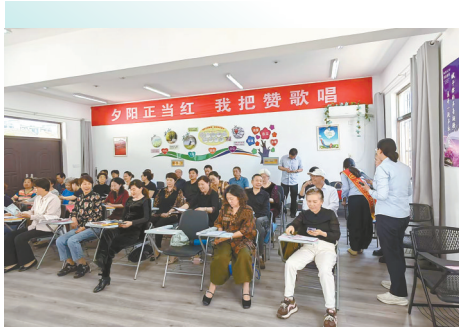
走进老年大学进行现场宣传