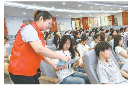
走进校园护航青春