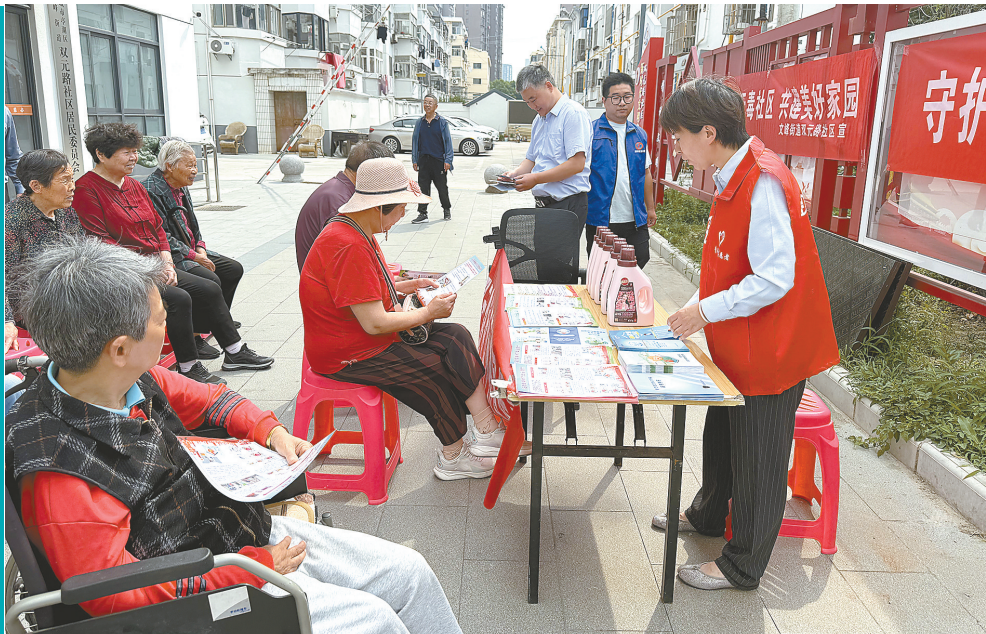
深入社区开展金融知识普及

一系列接地气的宣讲内容,补齐老年群体金融知识短板,纠正金融认知误区,切实提升老年人识诈、防诈、反诈综合能力,获得老年群众的一致好评。