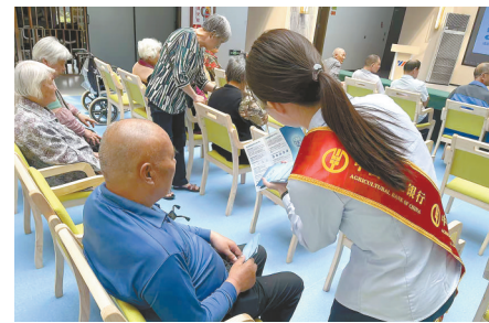
增强老年群体反诈意识