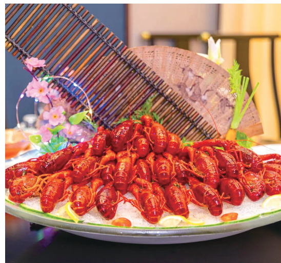
盐镇水街盐田夜市

COOL SUMMER! 龙虾盛宴 解锁盐城夏日舌尖狂欢 Summer 盐镇水街盐田夜市