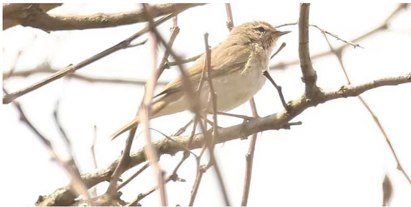
在盐城出现的叽喳柳莺。

盐城晚报讯 近日,记者从盐城市观鸟协会获悉,该协会会员在开展鸟类野外调查时,在大丰海堤路段观测到3只小型鸟类,其外形特征与本地常见的柳莺品类存在明显差异。经专家确认,这是我市首次记录到的鸟种——叽喳柳莺。