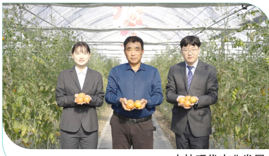
支持现代农业发展