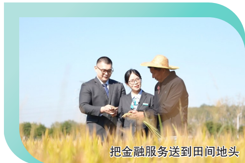
把金融服务送到田间地头

春回大地,万物竞发。漫步在盐都广袤的田野上,连片的标准化池塘波光潋滟,智能化农机在田间穿梭作业,一幅“农业强、农村美、农民富”的美丽画卷正徐徐展开。在这幅画卷背后,是农业银行盐城盐都支行以金融之力深耕“三农”沃土的生动实践。