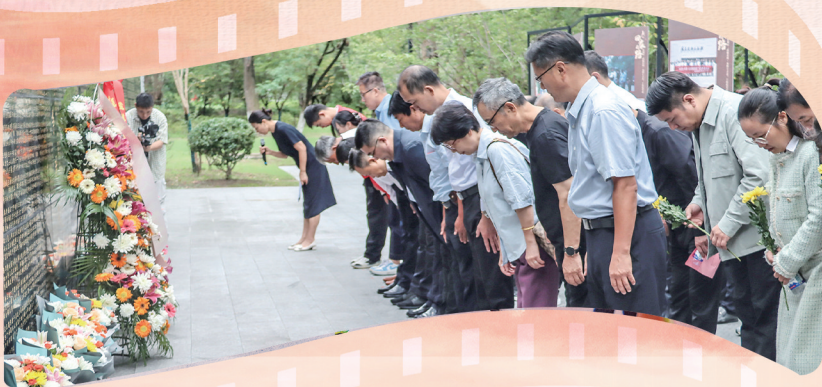
烈士亲属、“寻亲”志愿者和大学生志愿者代表在市革命烈士陵园烈士英名墙前敬献鲜花。