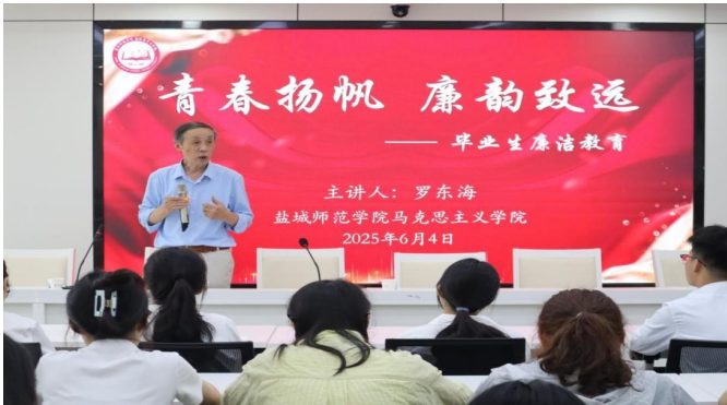
邀请老党员讲“新时代教师廉洁从教”专题党课