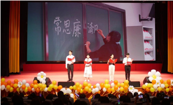
诗朗诵《廉镜——致未来的人民教师》

盐城师范学院马克思主义学院紧扣师范生培养关键环节,创新打造“艺术浸润+警示教育+实践养成”三维教育模式,于近日面向2025届毕业生开展系列廉洁教育活动,为即将踏上教育岗位的学子筑牢思想根基,助力他们系好廉洁入职“第一粒扣子”。