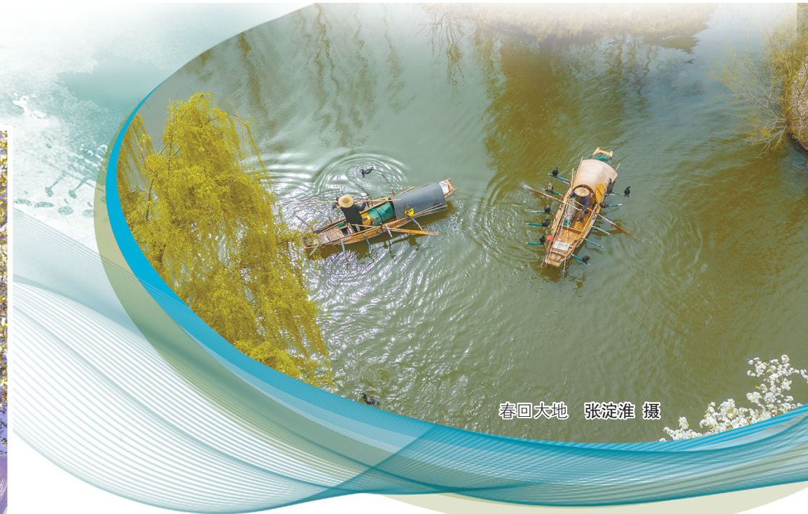
春回大地