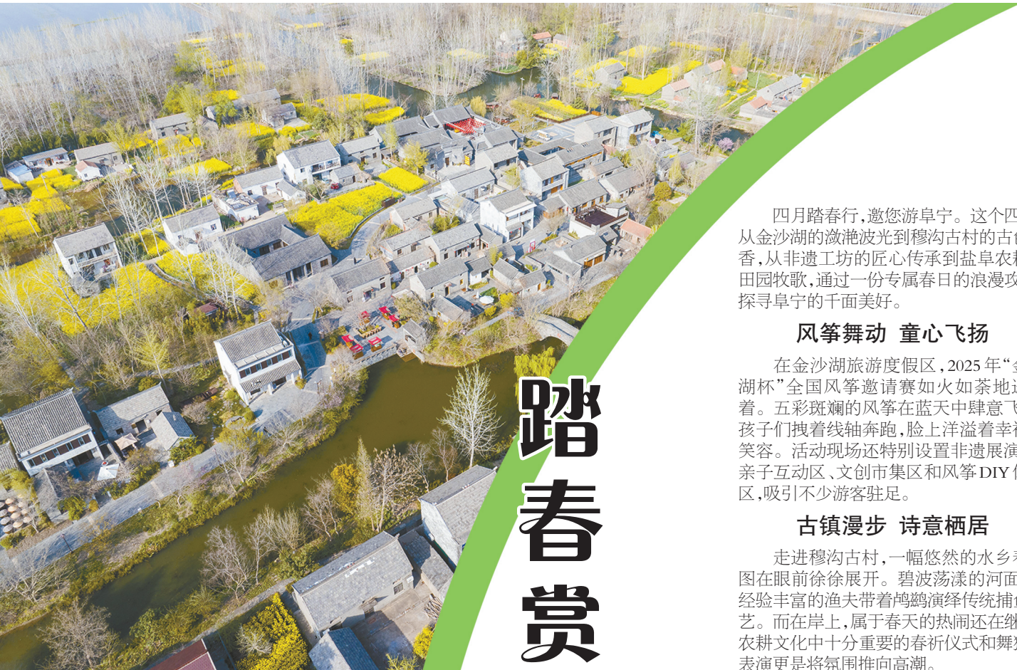
大地调色板