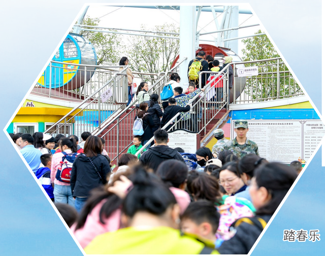
踏春乐 严社 摄