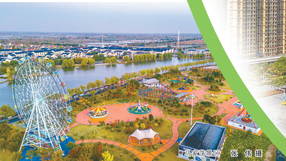
马家荡景区