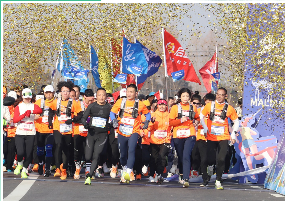
让我们一起跑进春天