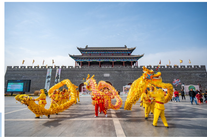
龙腾盛世