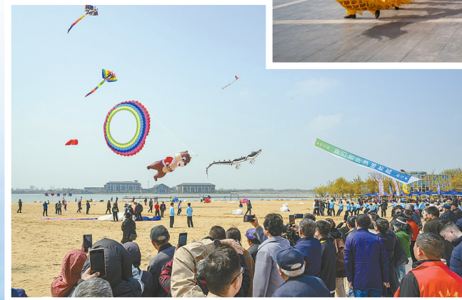
金沙湖风筝“向云端”