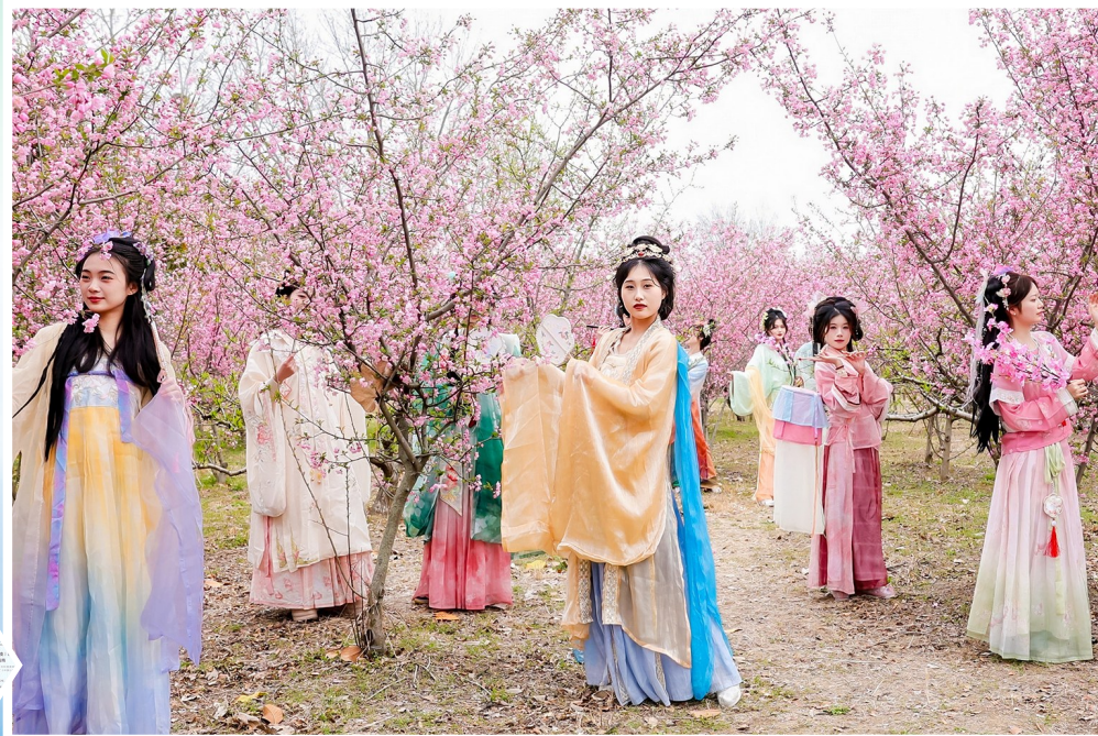
故道羊寨桃花盛,十里桃林春意浓