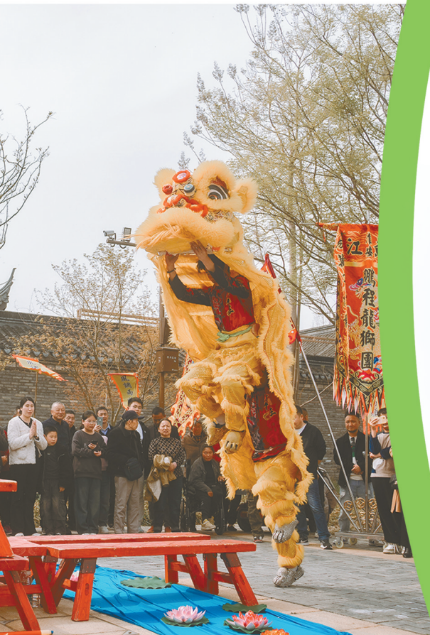
民俗表演展风情