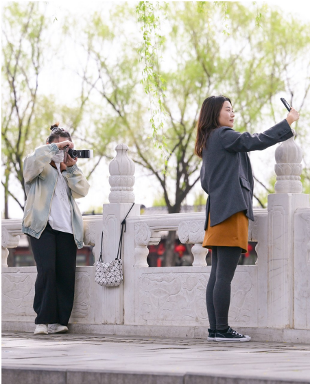
4月8日,一位旅拍摄影师(左)在北京后海北沿为游客拍摄照片。