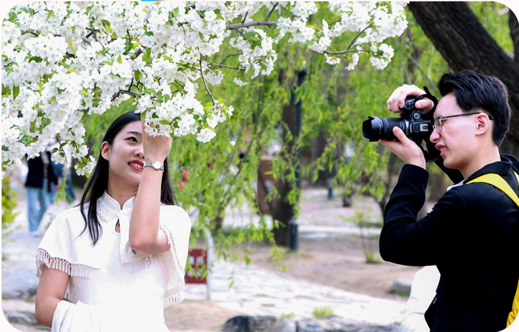
4月9日,游客在北京玉渊潭公园樱花园内留影。

2025年春天,春风和煦,春景烂漫。越来越多的摄影爱好者拿起手机、相机,或给春天留影,或与春天合影,形成一道独特的春日风景线。 近年来,随着智能手机摄影技术的提升和社交媒体的普及,全民摄影热情持续高涨。这股“摄影热”不仅丰富了民众文化生活,让更多人感受自然之美、记录美好瞬间,也带动春季旅游消费。