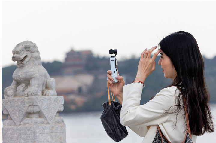
4月9日,游客在颐和园十七孔桥上拍摄。