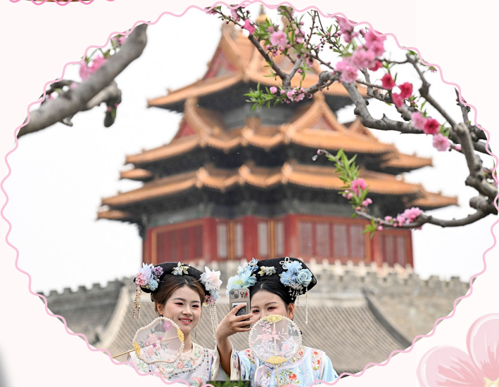
▲ 4月8日,两位相识于网上的学生在北京故宫角楼前自拍。她们分别来自河北和浙江,一起来北京游玩。