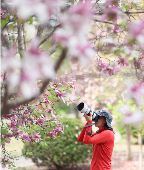
4月8日,在北京市海淀区一处街边花园,一位摄影爱好者在拍摄玉兰花。