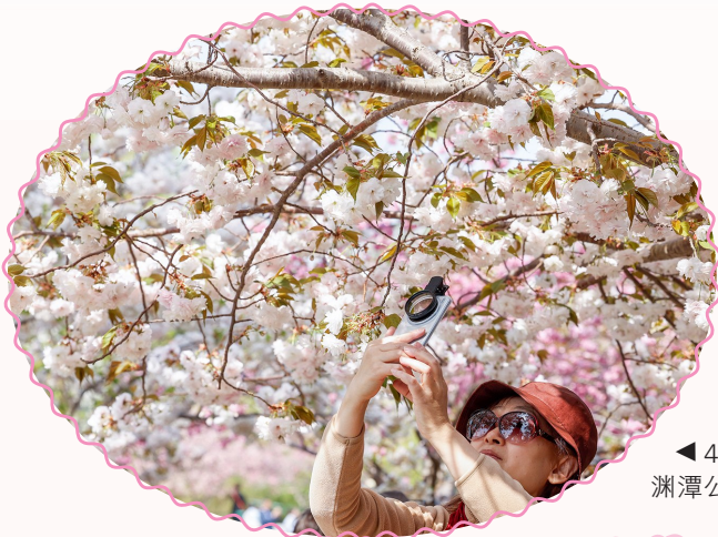
◀ 4月10日,游客在北京玉渊潭公园欣赏拍摄樱花。