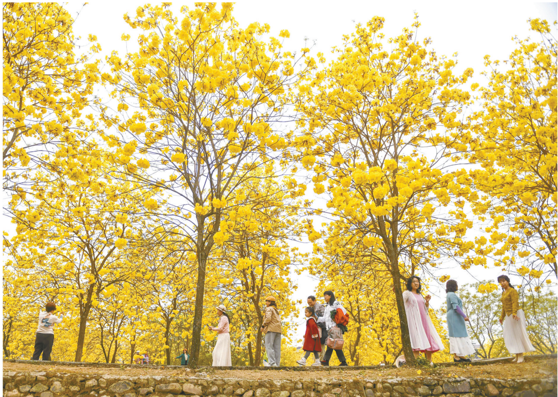
4月5日,在广西桂林市临桂区会仙镇岭上村,人们在黄花风铃木树下游玩。