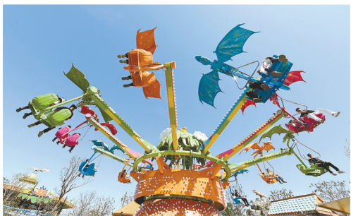
4月5日,在河南省沁阳市怀府恐龙园,游客体验“滑翔飞翼”游乐项目。