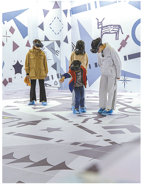
4月5日,游客在宁夏银川西夏陵景区VR体验区游玩。