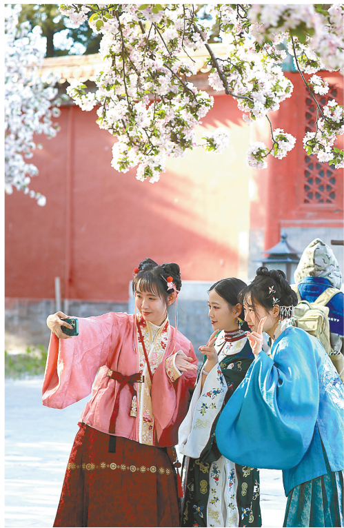
4月5日,游客在北京故宫文华殿前自拍留念。