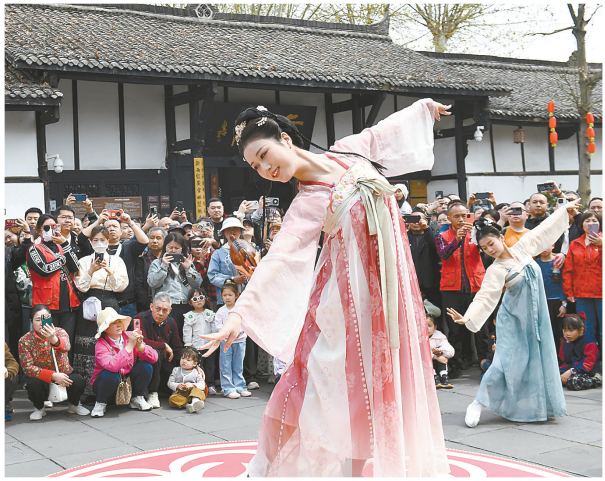
4月5日,游客在四川省阆中古城贡院广场观看“鼓上舞”。