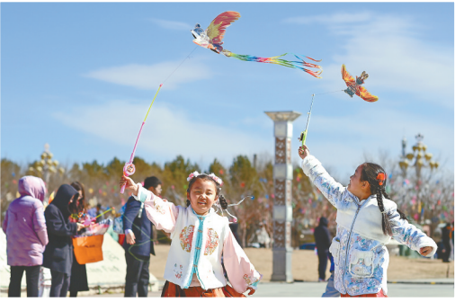
4月4日,小朋友在内蒙古鄂尔多斯市康巴什区春日文旅活动现场放风筝。