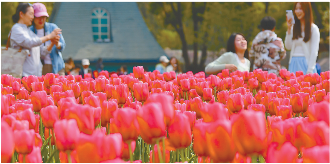
4月5日,游客在江苏无锡梅园赏花游玩。