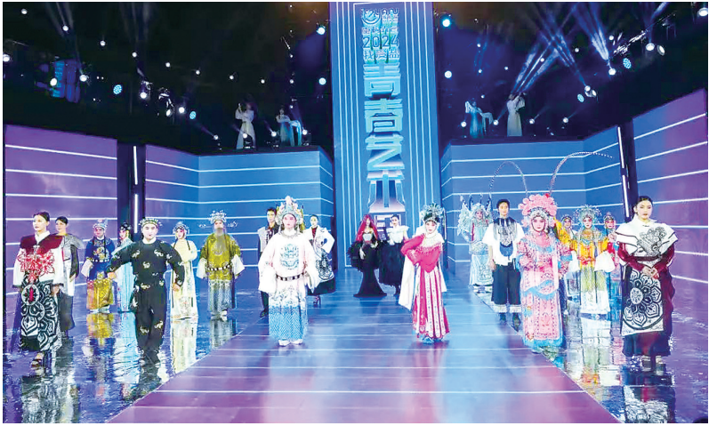
市美术馆举办的展览精彩纷呈(资料图)