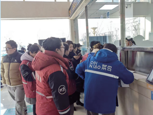
12月20日上午,阜宁县总工会组织40名新就业形态女性劳动者在阜宁县现代医院开展“两癌”筛查活动。