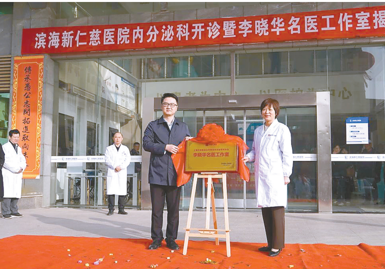
图为揭牌现场

11月2日,滨海新仁慈医院成功举办内分泌科开诊暨李晓华名医工作室揭牌仪式。 滨海新仁慈医院积极响应健康中国战略,针对疾病老年化趋势及糖尿病等健康问题,专注发展特色专病。将上海等一线城市的优质医疗资源下沉到县域城市,让本地患者在家门口就能享受到三甲医院优质的医疗服务,解决患者外出看病难问题,真正体现宏信健康“好医疗无须远行”的价值观。 当天上午,上海市第七人民医院教授李晓华到该院开展大型义诊活动,为群众提供健康知识宣讲、免费诊疗等服务。 此次活动的成功举办,标志着滨海新仁慈医院特色专病学科建设再上新台阶。未来,该院将继续秉承“以患者为中心”的服务理念,不断提升医疗服务质量,为广大市民带来更加优质、高效的医疗服务。 辛文