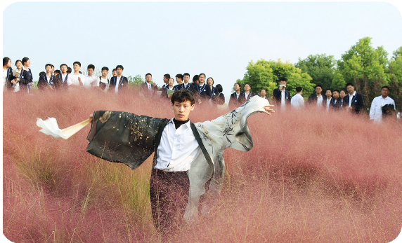
在花海中翩翩起舞