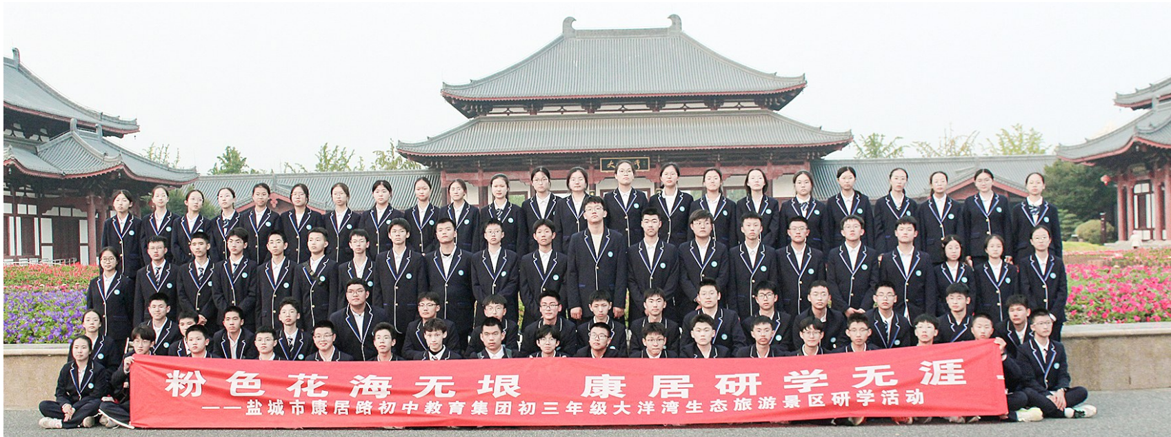
粉色花海无垠 康居研学无涯 ——盐城市康居路初中教育集团初三年级大洋湾生态旅游景区研学活动