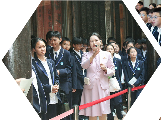
了解徽派建筑风格