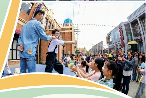
燕舞(大纵湖)剧工厂