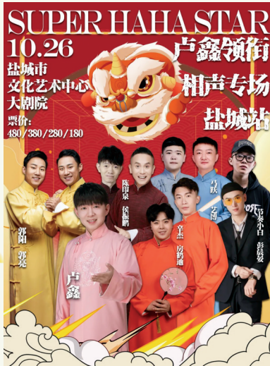
卢鑫相声专场海报