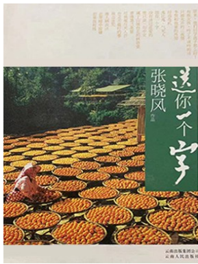
版本:云南人民出版社 作者:张晓风 《送你一个字》

书中的“真”字也让我感触颇深。张晓风说:“真,是生命中最可贵的品质。”在这个纷繁复杂的世界里,我们常常被虚假的表象所迷惑,忘记了真实的自己。只有保持一颗真诚的心,才能在人生的道路上走得更远。真诚地对待自己,勇敢地面对自己的内心,不逃避、不虚伪;真诚地对待他人,用