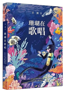
版本:河北少年儿童出版社 作者:王棵 《珊瑚在歌唱》