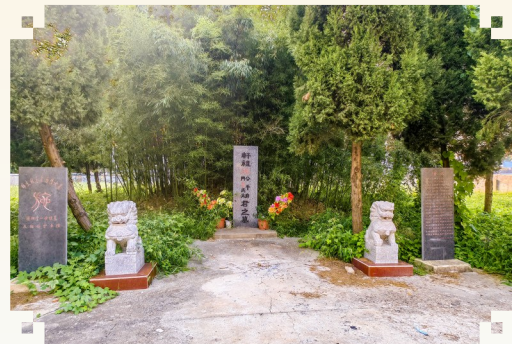
这座合葬墓有600多年的历史