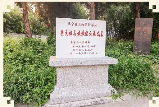
合葬墓被阜宁县列为文物保护单位