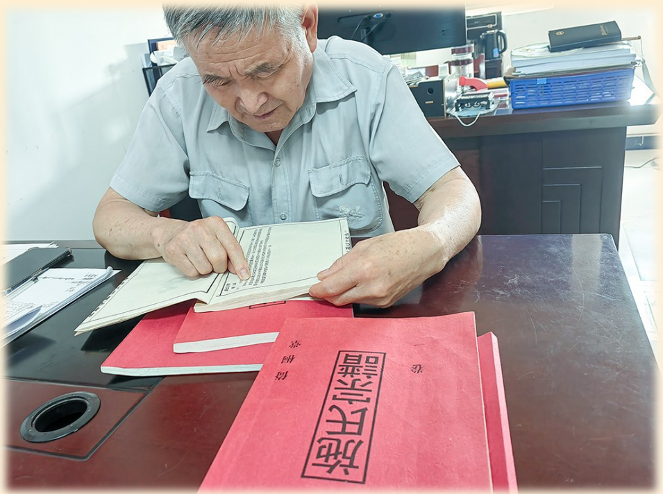
施华老人在看新修的《施氏宗谱》

据史料记载,明太祖的皇后马氏,亲生父亲是安徽宿州人,被称为马公。马公祖上是大富大贵的人家,马公乐善好施,经常救济贫困百姓。马氏母亲姓郑,在1332年生下马氏不久