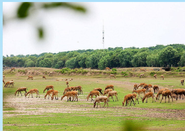
黄海野鹿荡