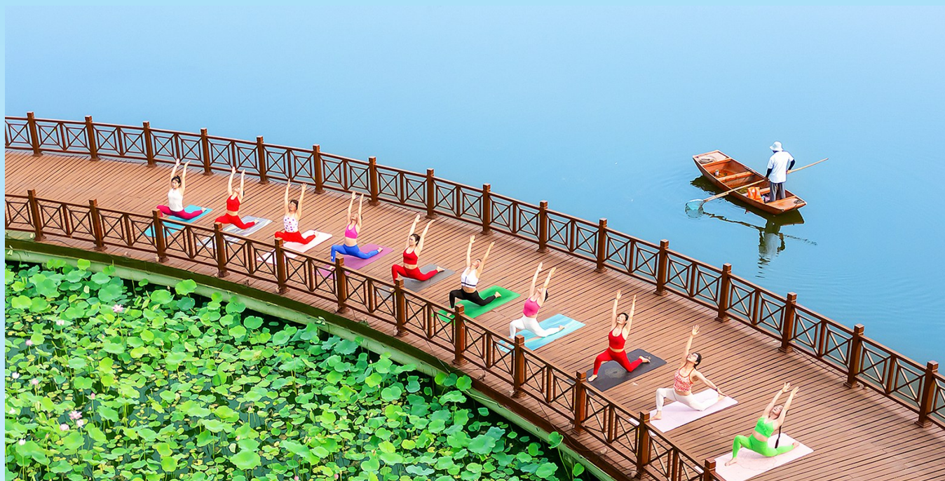
瑜伽健身