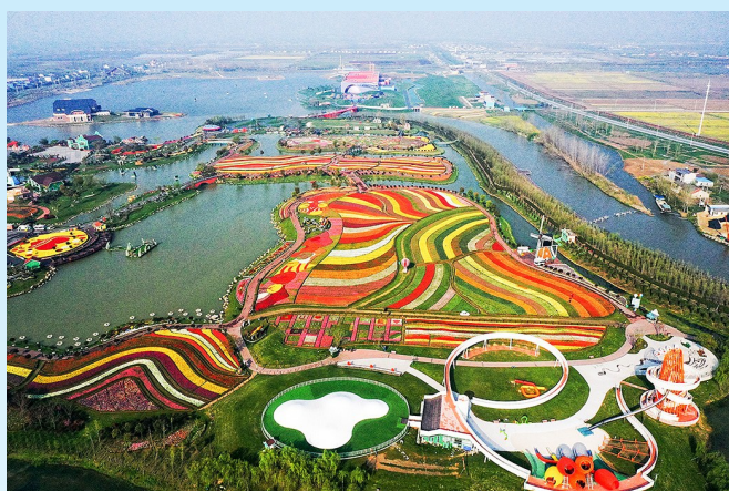
浪漫的花海