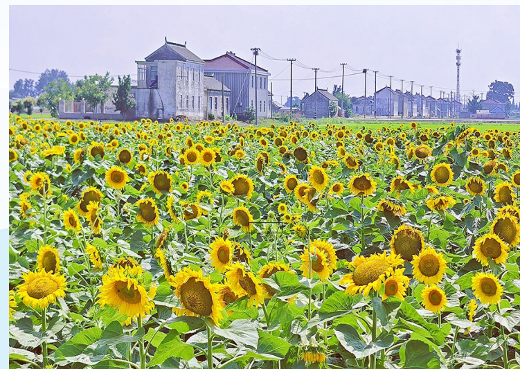
身边的“诗与远方”