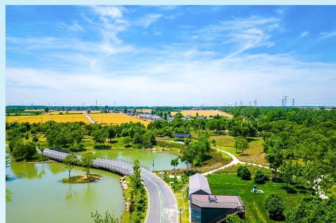
蟒蛇河畔好风光