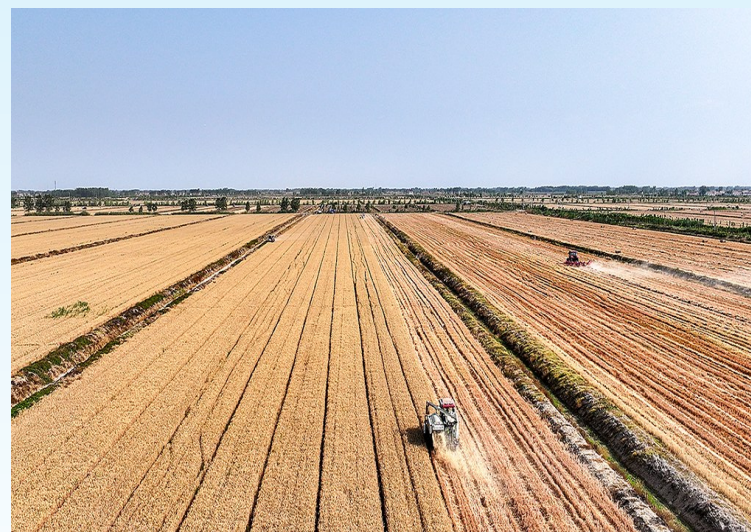
芯谷万亩收割忙