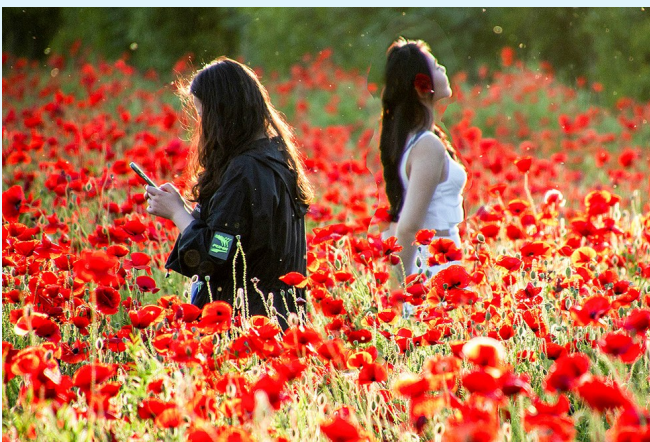
花海观影