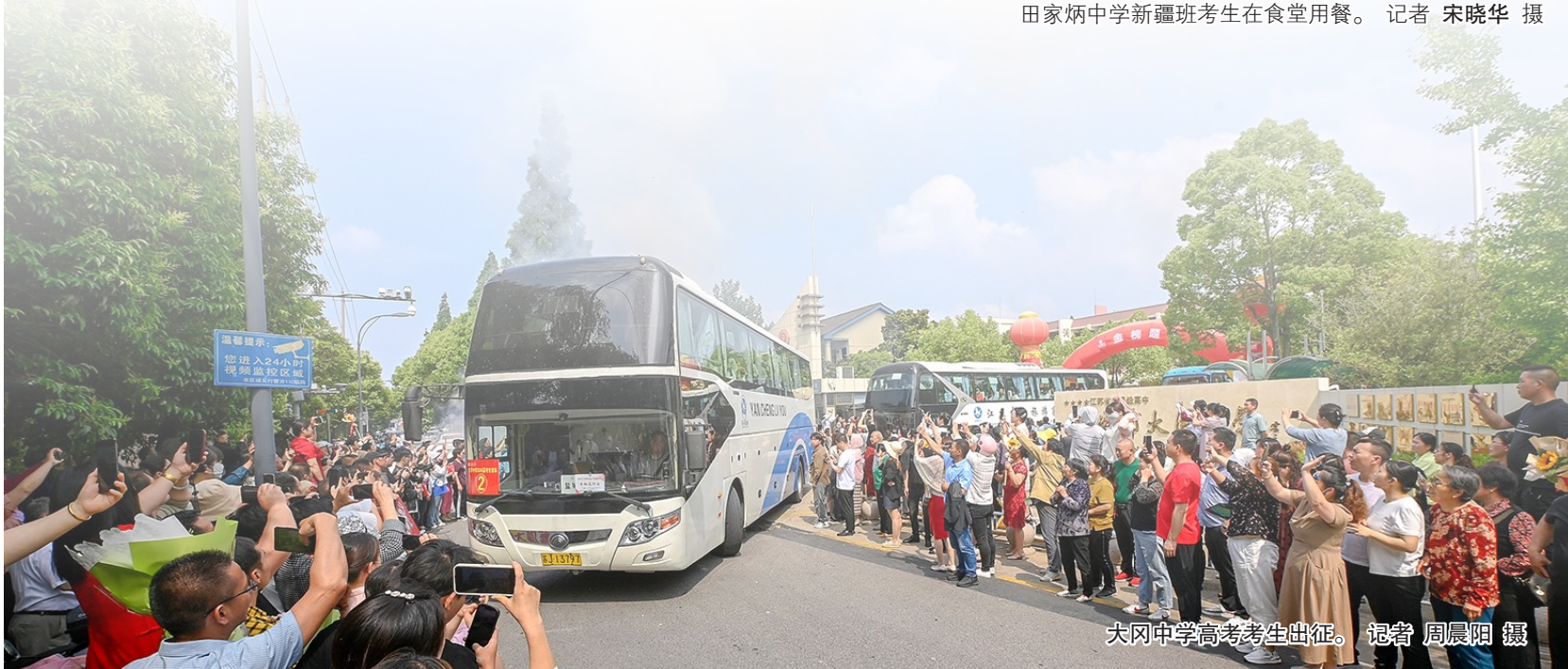
大冈中学高考考生出征。