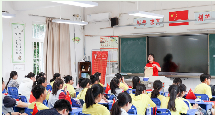
最后一节课上,龙冈中学老师叮嘱高考注意事项。