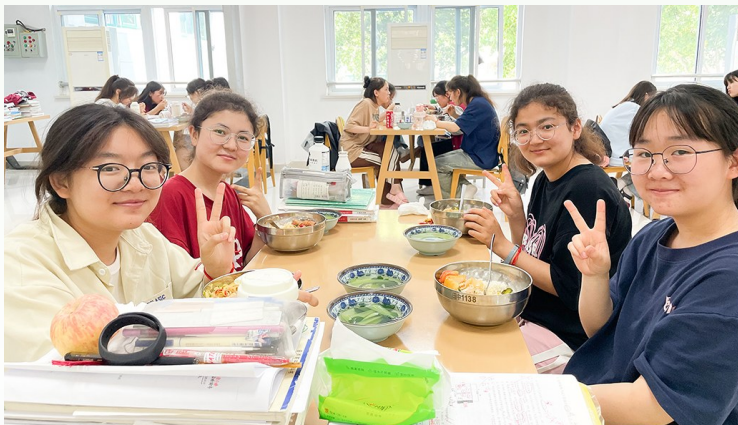
田家炳中学新疆班考生在食堂用餐。