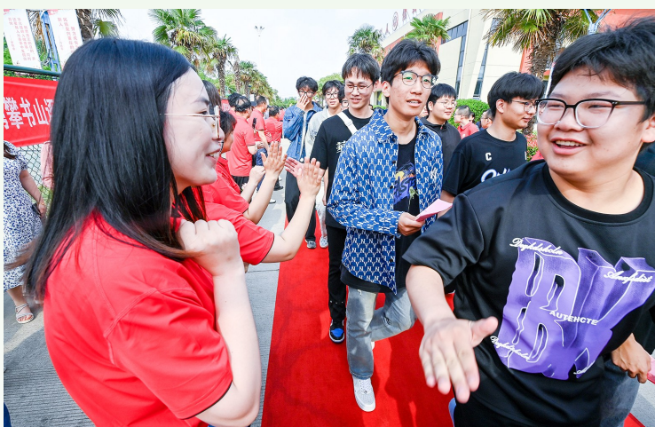
大冈中学考生们带着老师、家长们的祝福奔赴考场。