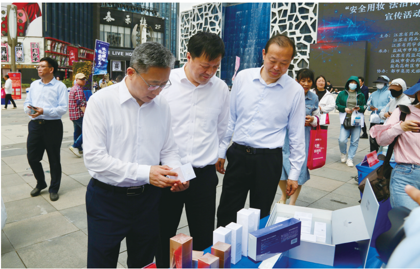
与会嘉宾驻足观摩

启动仪式上,诗朗诵、小品、爱肤日知识有奖竞猜等节目精彩纷呈。“化妆品的世界,缤纷而多彩,安全与法治,是永恒的纽带。在安全用妆的道路上,法治是我们坚实的依赖。”主题诗朗诵《法治护航 美丽绽放》将“安全用妆”和“法治同行”结合起来,引导人们在追求美丽的同时,也要注意