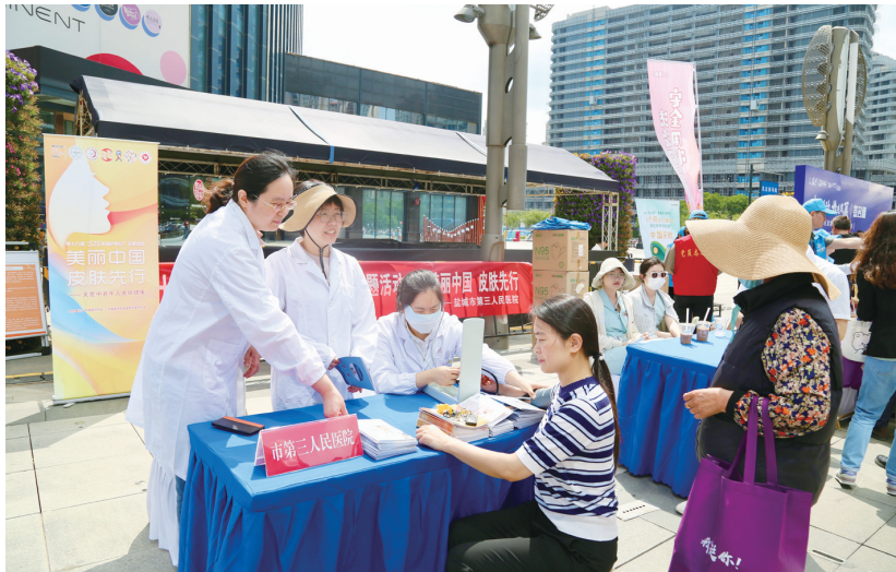
市三院皮肤科专家现场义诊

重安全和法律的保障。自编自导自演的小品《安全用妆 苏妆GO!》,以幽默风趣的方式,讲述在日常生活中如何正确选择和使用化妆品,以及如何通过“苏妆GO”监管小程序在生活中发挥作用,确保大家的安全用妆。