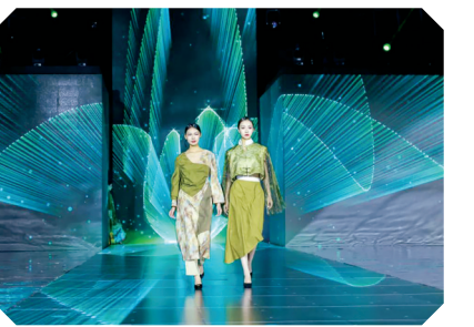
青春时装秀《绿色湿地》