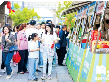
游客打卡美食摊位