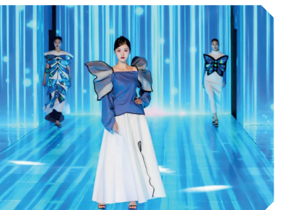
青春时装秀《向海图强》