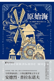
版本: 浙江文艺出版社 作者: 安德烈·普拉东诺夫 《原始海》