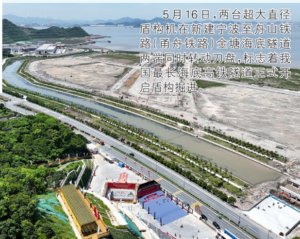
5月16日,两台超大直径盾构机在新建宁波至舟山铁路(甬舟铁路)金塘海底隧道两端同时转动刀盘,标志着我国最长海底高铁隧道正式开启盾构掘进。