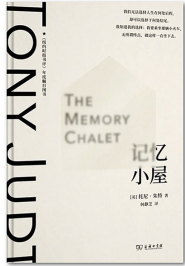
版本:三辉图书·商务印书馆 作者:托尼·朱特 《记忆小屋》

女性、衰老、爱情……阿连德在这本具有自传性质的回忆录中,回忆了自己出生、婚姻、育儿、工作以及贯穿终身的对于女性一体的思索。她关于衰老的描述,她谈到死亡,她谈到生命里那些女性的灵魂……这是一位80岁的女作家回望自己的来路,她思考的仍然是“我们想要怎样的世界”这一永恒的问题。综合