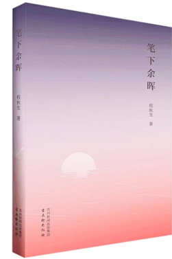
版本:古吴轩出版社 作者:程秋生 《笔下余晖》

尊重与引导,是孩子成长的最佳陪伴。在《儿子的创意》一文中,毕淑敏以其独特的视角,深入浅出地阐述了如何让孩子在自在的环境中茁壮成长。文章主要讲述了“儿子”要参加日本的创意比赛,“妈妈”却一味挖苦“儿子”,然而儿子却真的拿到了奖。文中的妈妈虽然会讽刺孩子几句,但她仍真诚地与孩子沟通交流,对孩子的创造精神给予呵护与支持。真正的教养,不是逼迫孩子成为我们希望的样子,