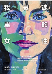
版本:译林出版社 作者:伊莎贝尔·阿连德 《我灵魂里的女性》

在以往的研究中,大多侧重杜甫的后半生,前半生却很少有深入考证,而这恰恰是他思想和认知的形成发展期。青年学者王炳文以历史学的研究方法,重走诗圣的前半生,将杜甫置于家族、社会、政治斗争以及地缘格局中,关注其思想认知的形成发展期,看杜甫如何成为杜甫,考证并还原出一幅杜甫当日所目睹、所身处的盛世历史图景,抵达一个伟大的时代,重新理解“诗史”的意义。凌俊