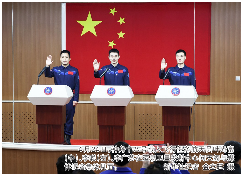
4月24日,神舟十八号载人飞行任务航天员叶光富(中)、李聪(右)、李广苏在酒泉卫星发射中心向媒体记者集体见面。

新华社酒泉4月24日电 我国瞄准4月25日20时59分发射神舟十八号载人飞船,飞行乘组由航天员叶光富、李聪、李广苏组成。