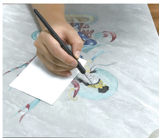
学生在给作品赋色。