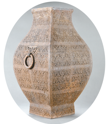
这是武王墩墓出土的铜钁(2024年4月8日摄)。

新华社合肥4月16日电 聚焦武王墩墓考古、出土文物保护与墓葬保护最新进展,国家文物局16日在安徽省淮南市召开“考古中国”重大项目重要进展工作会。武王墩墓是经科学发掘的迄今规模最大、等级最高、结构最复杂的大型楚国高等级墓葬。