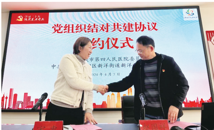
共建协议签订现场。

活动现场人头攒动,热闹非凡,专业的医疗服务受到了社区居民的一致好评。“我本来就有鼻窦炎,最近换季又感觉不舒服了,正准备去医院。下楼发现有这个活动,就现场咨询了医生,医生给我做了细致的检查,还教我生活中要注意些什么,我