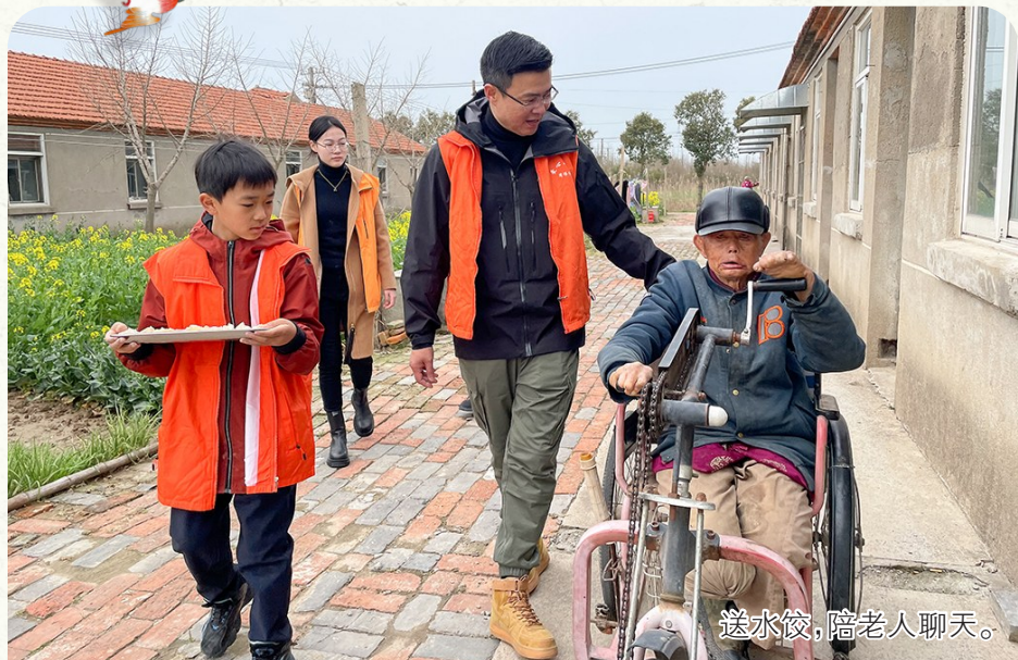
送水饺,陪老人聊天。

“你们又来啦,今天休息啊?” “是的,今天包水饺给你们吃,还有人唱戏给你们听。”3月31日一大早,位于盐城经济技术开发区步凤镇境内的步凤镇康复院热闹了起来,盐城爱心之家的近30名志愿者如约来到这里,看望大半个世纪前因麻风病在此扎根的一群特殊老人。从2015年初开始,每月一次的探望,是他们与老人的约定。