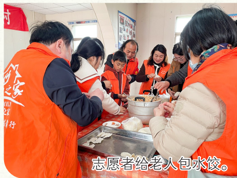
志愿者给老人包水饺。