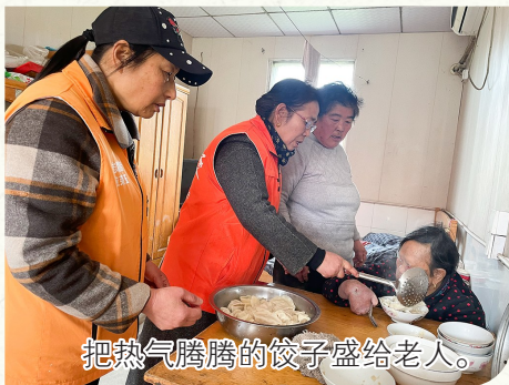
把热气腾腾的饺子盛给老人。