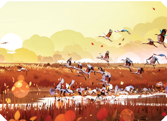
丹顶鹤湿地生态旅游区