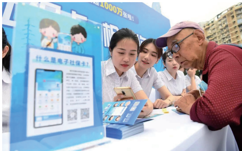
一位重庆市民在工作人员指导下开通电子社保卡(资料图)。