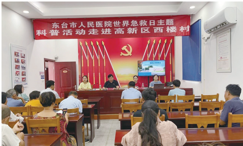
该院开展健康促进主题宣传活动。(资料图)

围绕年度主题健康日,统筹开展各种形式的健康促进主题宣传活动,该院成立“百名专家走基层”服务小组,组建志愿健康科普团队,累计服务群众10万余人次。该院公众号设立健康科普专栏,推出106期《上新了!东医特色科普系列》原创科普视频。参加各类省、市科普竞赛活动,获得省、市级奖项10余次。强化健康教育阵地建设,规划设置健康角、健康大讲堂。