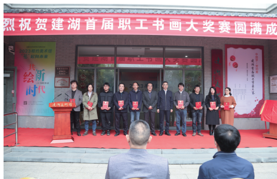
图为一等奖颁奖现场

本次职工书画大赛是建湖县总工会联合县文联等单位为丰富职工的精神文化生活,推动全县精神文明建设而开展的一项重要赛事。活动自9月份启动以来,全县职工书画爱好者积极响应,以“中国梦·劳动美——匠心映初心 丹青颂国庆”为创作指引,精心创作了400多幅书画作品,经过大赛评审委员会三轮评审,共有130幅作品获奖。这些作品会同29幅特邀作品、10幅评委作品一起分批次在县美术馆展出,为大家带来一场文化艺术盛宴。