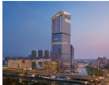
盐城万豪酒店: 风尚地标