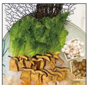
天沐温泉度假酒店 极品野生菌姿造