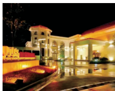
大丰半岛温泉 酒店:尊荣雅趣