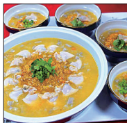
东台鱼汤面西溪店 蟹黄文蛤芋头羹