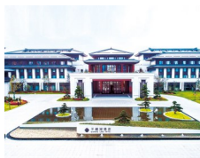
千鹤湖酒店: 惬意人生