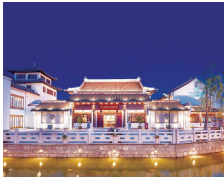
东晋水城开元 酒店:自在悠然