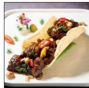
盐城希尔顿酒店 罗勒珍果和牛粒