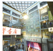
竹林大饭店: 人文盐城