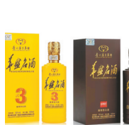
华盛名酒: 名扬天下