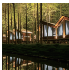
黄海森林:氧吧之旅