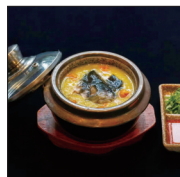
盐城世纪城市酒店 凤依湖蟹粉鱼脑