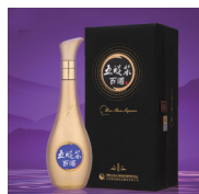
五醒浆: 更多老酒 更柔顺