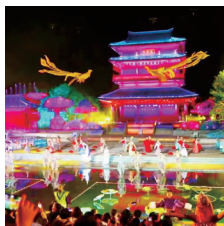
东台西溪:千年福地