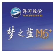
洋河梦之蓝:中国 匠造 梦想之光