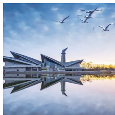
丹顶鹤湿地:仙鹤家园