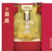
国缘: 成大事 必有缘