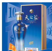
蓝色经典-天之蓝: 男人的情怀