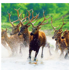
中华麋鹿园:世外仙境