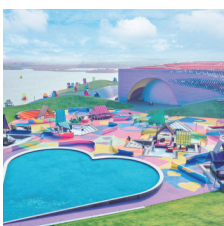
荷兰花海:生态画廊