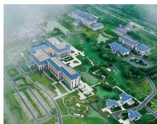
九龙口温泉酒店: 温润涵养