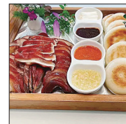
毕华丽庄园 特色烤猪脸