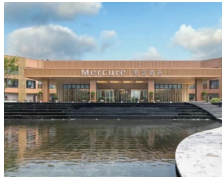
黄海森林美居 酒店:绿色氧吧