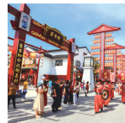
西溪草市街: 人间烟火