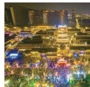
盐镇水街: 享受当“夏”