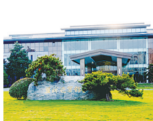
盐城迎宾馆: 城市名片