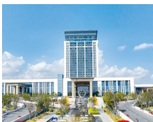
月亮湾维景国际 大酒店:观海听潮