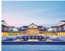
大洋湾希尔顿逸 林酒店:奢华舒适