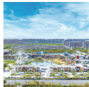
KK-PARK 国际 街区:玩转潮流