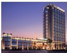
九龙国际大酒店: 奢华享受