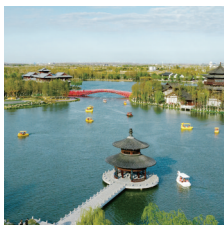
大洋湾:一湾揽古今