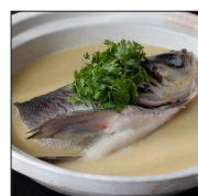
九龙口温泉酒店 温泉浓汤鱼头煲