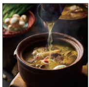
山芋腔苏北菜 苏北草鸡汤