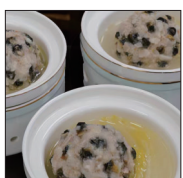
东晋水城开元酒店 螺蛳狮子头