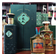
江苏人:时间是 最好的调酒师