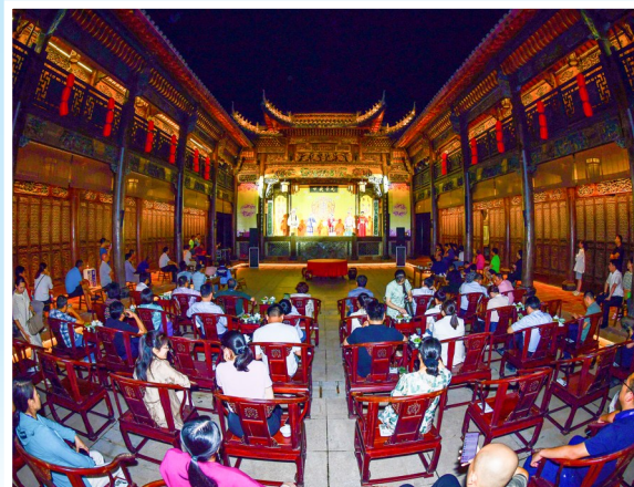
8月23日,2023年传媒年会·生态传播论坛暨“全国党媒客户端@盐城”融媒体采风行嘉宾陆续抵盐。报到结束,嘉宾们迎着晚霞登上大洋湾登瀛阁鸟瞰景区,随后游览并观看淮剧表演,大家或深呼吸,或拿出手机记录美景,赞叹盐城好生态、好风景。