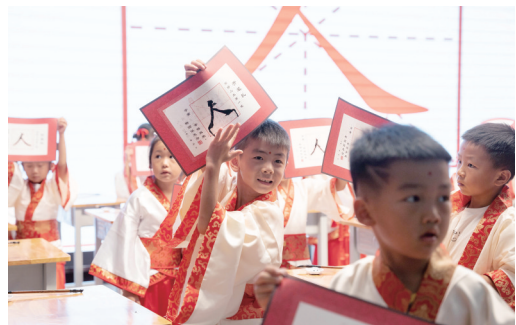
一年级新生在贵州省铜仁市雅礼学校新生入学仪式上举行开笔礼。