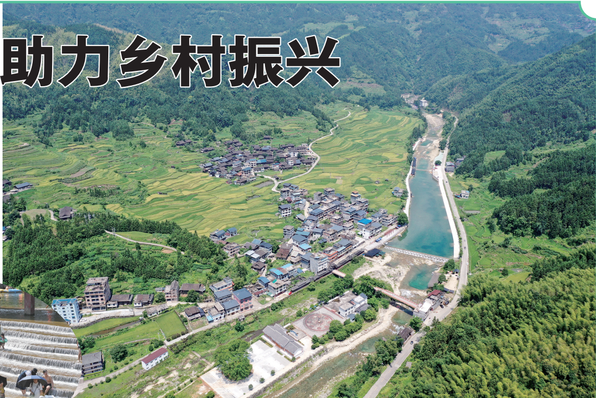
融水苗族自治县香粉乡雨卜村整治后的河道、村庄、旅游设施等(8月19日摄,无人机照片)。