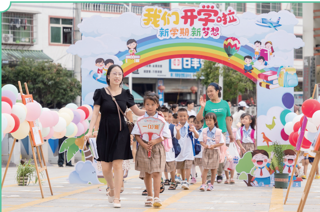
一年级新生走进贵州省铜仁市第二十四小学校园。