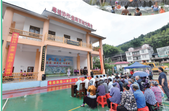
融水苗族自治县怀宝镇盘荣村村民在新建的粤桂协作文化戏台前观看演出(5月26日摄)。