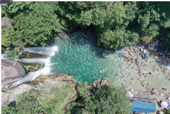
游客在融水苗族自治县香粉乡中坪村三友瀑布景区戏水消暑(8月19日摄,无人机照片)。