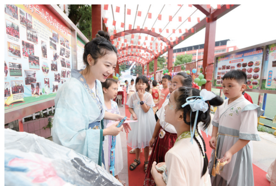
学生在贵州省黔东南苗族侗族自治州黄平县新州镇第二小学猜谜语。