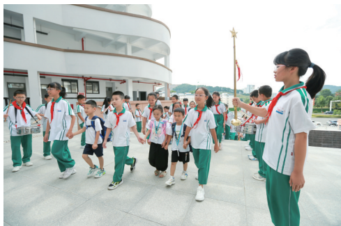
贵州省都匀市第二完全小学高年级的同学带领一年级新生参观校园。