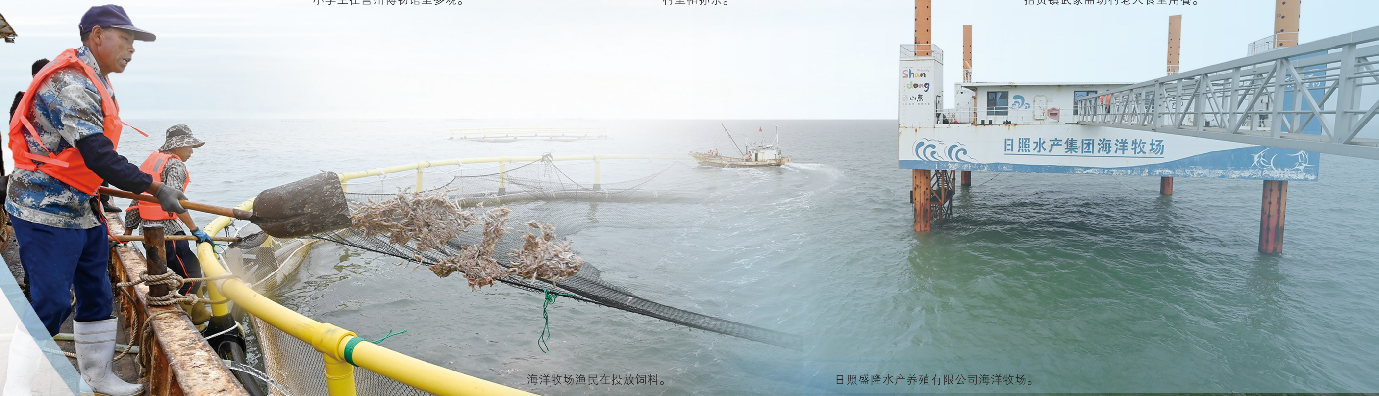
海洋牧场渔民在投放饲料。