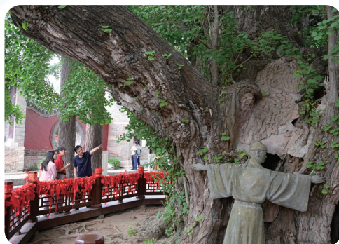
莒县浮来山近4000年树龄的银杏树。