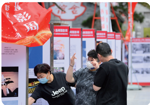
当地群众观看摄影展。

5月24日至26日,第六届中国(日照)新闻摄影周在山东省日照市举行,来自人民日报、新华社、光明日报、中国日报、中国新闻网、工人日报、农民日报等中央媒体和全国各地的100多位主流媒体的摄影记者齐聚日照,用镜头聚焦日照的生态之美、发展之美、人文之美和人民群众的幸福生活。作为“摄影记者之家”建设的一项重要举措,摄影周通过图片展览、学术研讨、集体采访、业务交流等形式,促进新闻摄影队伍践行“四向四做”,不断提升脚力、眼力、脑力、笔力。