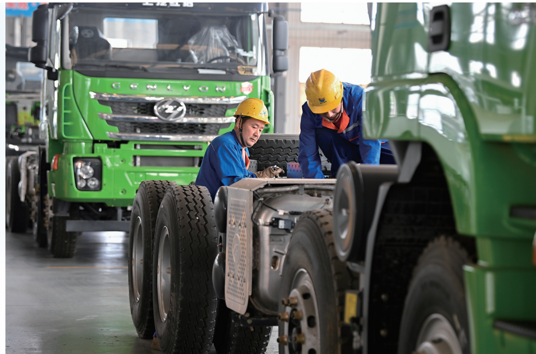
山东海汇环保设备有限公司生产线上忙碌的工人。