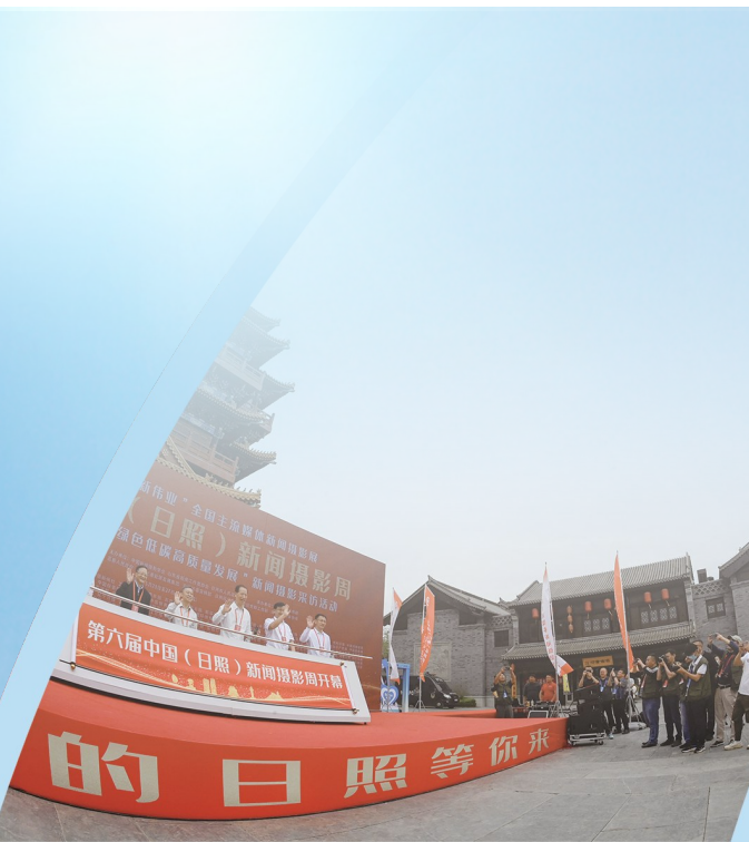
5月24日,新闻摄影周在日照市莒县莒国古城开幕。