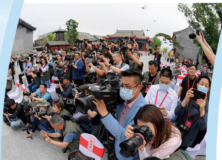
开幕式上的各家媒体的摄影记者。