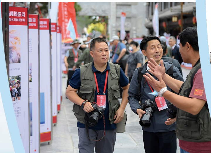
三个大型图片展览“礼赞新时代 再创新伟业”全国主流媒体新闻摄影展”“新闻摄影的时代责任”业务交流展”“阳光海岸 活力日照”摄影作品展”引来摄影记者们的关注。