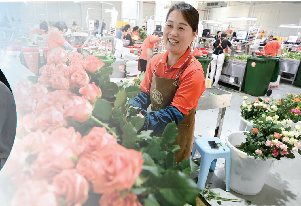
素有“玫瑰小镇”之称的山东日照莒县招贤镇,当地鲜切花玫瑰十分畅销,精心包装的鲜切花发往北京、上海、广州等一线城市,催热“浪漫经济”。