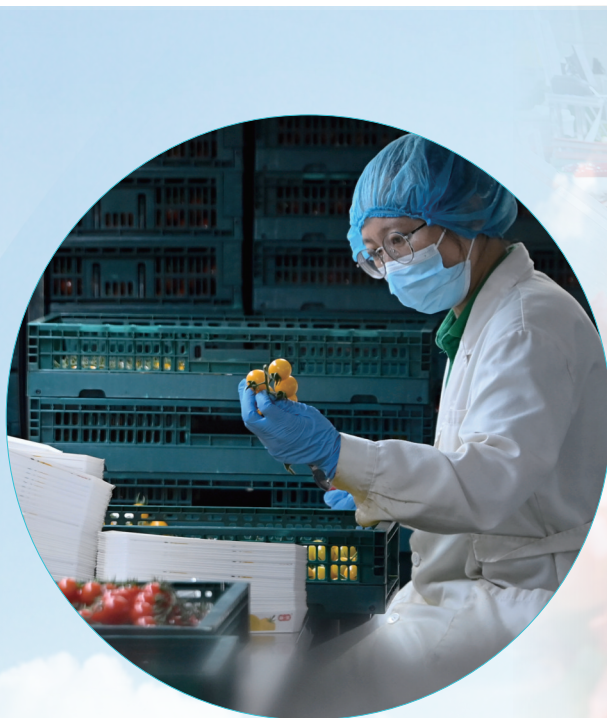
曲坊现代农业产业园分装西红柿。