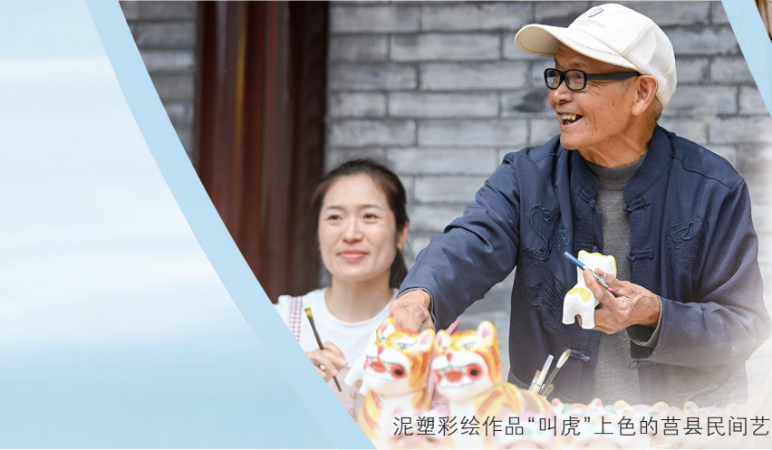
泥塑彩绘作品“叫虎”上色的莒县民间艺人。