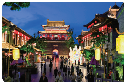
莒国古城的夜晚流光溢彩。