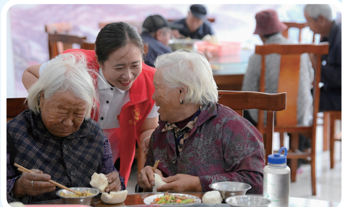
招贤镇武家曲坊村老人食堂用餐。