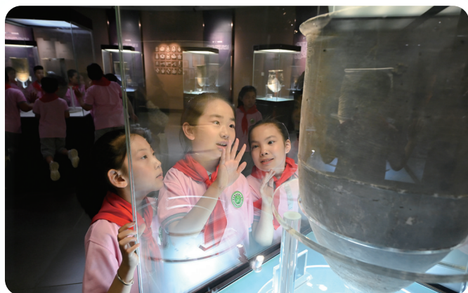
小学生在莒州博物馆里参观。

投稿邮箱:yfdzbyx@126.com 《影像盐城》编辑部 联系电话:15051089688 陈先生。