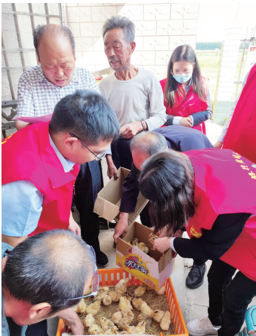
残疾人领到苗禽、慰问品,开心不已。

盐城晚报讯 “今天领到50只苗鸡、大米、食用油等慰问品,还学到了养禽新技术,收获真不少啊。”5月19日,盐都区大冈镇躬休乐园与南京银行盐城分行围绕“爱心相伴,助残同行”主题,开展第33个全国助残日活动,76名残疾人欢聚一堂,大家捧着沉甸甸的慰问品,开心不已。