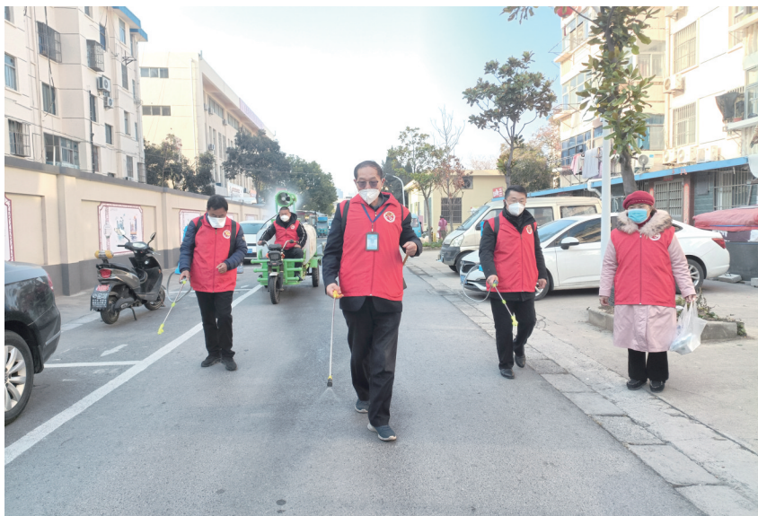
开展公共场所环境卫生消毒和保洁活动。

市文明创建巡访团还发出倡议:“每个人都是自己健康第一责任人。要积极接种疫苗,科学佩戴口罩,勤洗手,注意咳嗽礼仪,不乱吐痰,在公共场所保持社交距离。居家和工作场所定时开窗通风,做好居室日常卫生。让我们用千千万万个文明健康小环境筑牢疫情防控社会大防线。”