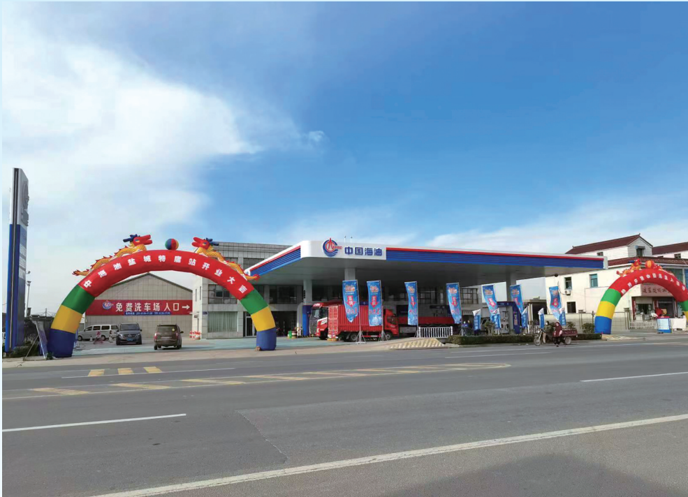
特庸加油站盛装开业场景

盐城晚报讯 12月1日,中海油销售盐城有限公司特庸加油站彩旗招展、喜气盈门:在市民的热情期盼中,加油站盛大开业。身着统一海油服、配带工号牌的营业员,热情地接待每一位客户。