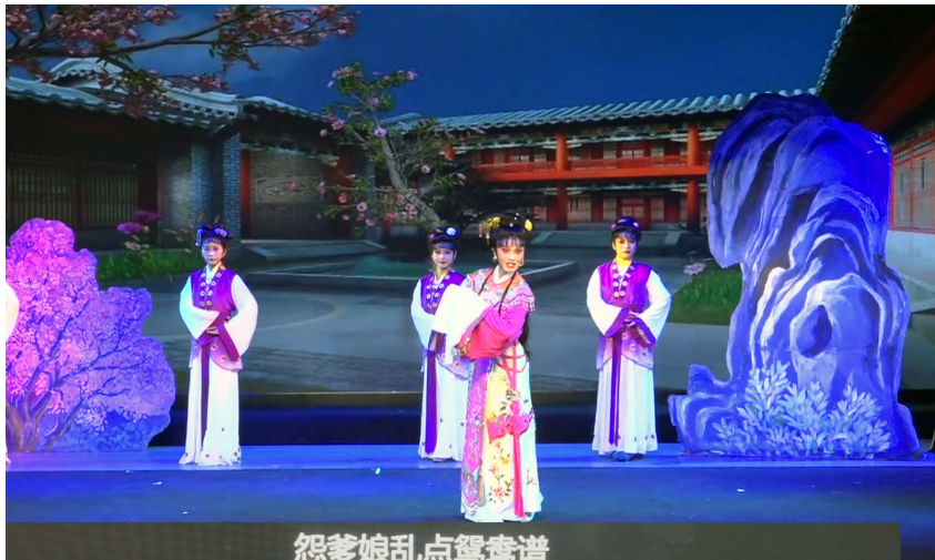
怨菱娘乱点鸳鸯谱