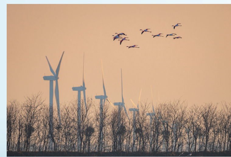
火烈鸟的“风光”之旅