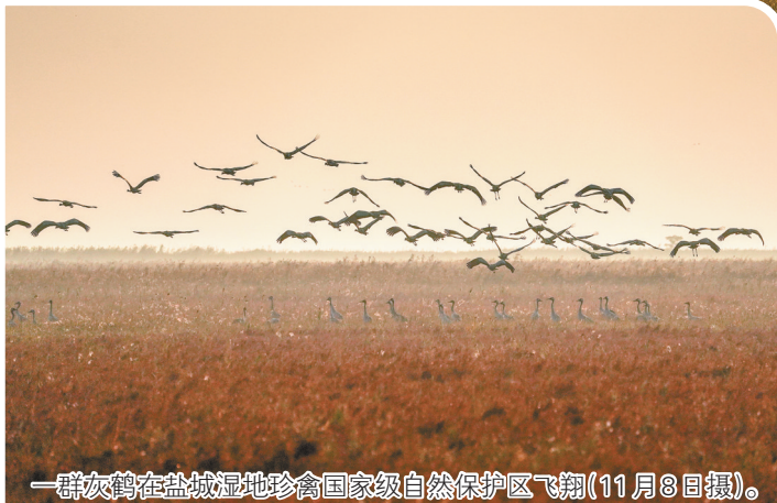
一群灰鹤在盐城湿地珍禽国家级自然保护区飞翔(11月8日摄)。