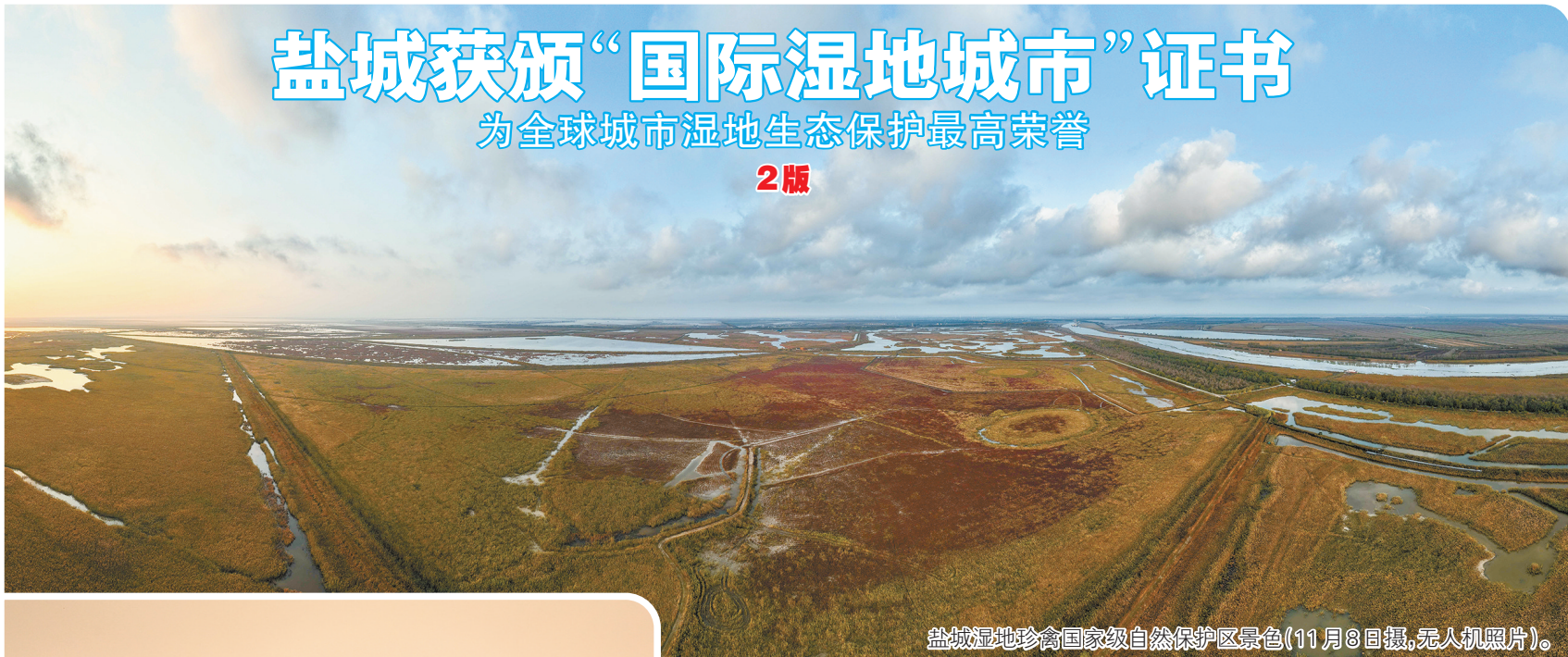
盐城湿地珍禽国家级自然保护区景色(11月8日摄,无人机照片)。