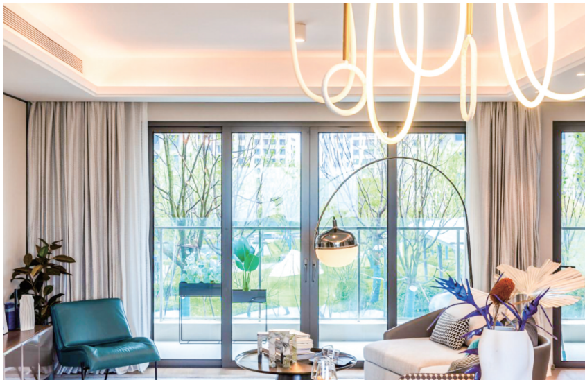
仁恒滨河世纪效果图(房企供图)

盐城晚报讯 11月3日,亭湖区高质量发展项目城中片区集中观摩活动圆满举行,仁恒·滨河世纪作为城中高端人居优质项目代表,被此次活动列为观摩与检验的住宅项目,获得一致好评。