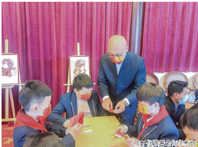
孩子们跟着老师学剪纸