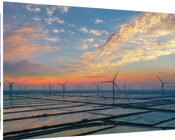
滩涂“风”光