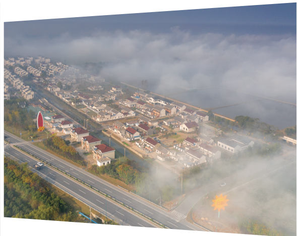
特色田园花吉村