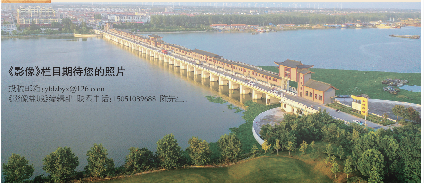
射阳河闸焕然一新