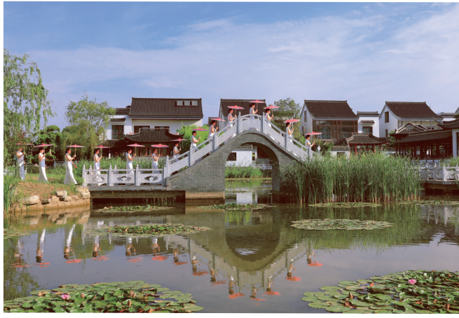
美丽宜居新农村