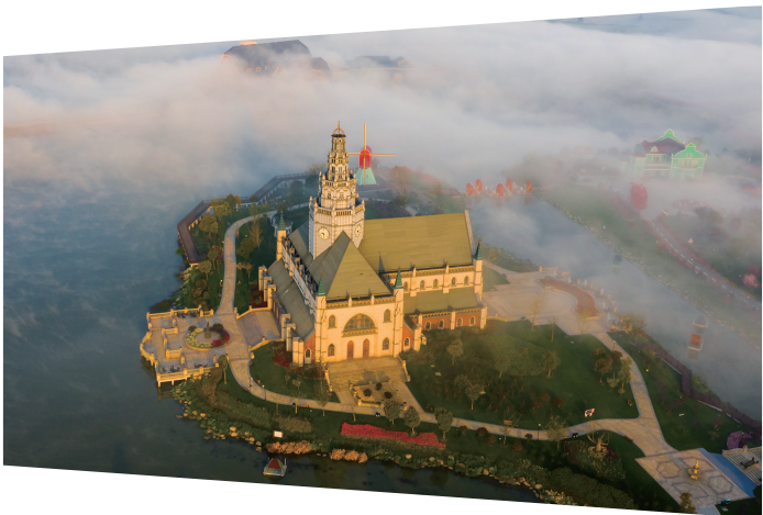
花海晨雾