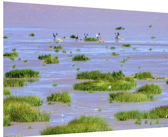
和谐湿地