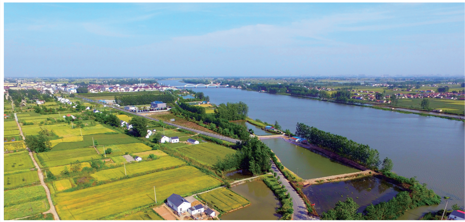
绿水润农田