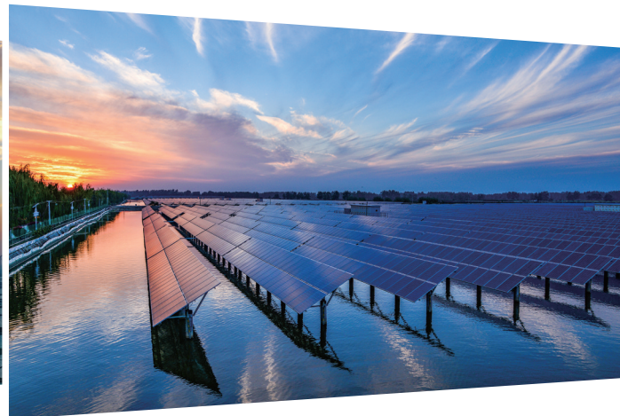
渔光互补