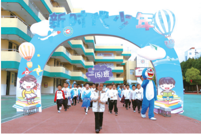
孩子们以饱满的热情走过拱门。

盐城晚报讯 10月21日,盐城市建军路小学少工委、关工委组织开展了“小小少年筑梦新时代”为主题的教育活动。此活动是为了激励一年级的孩子们成为一名小学生后,作为新时代的少年要立志气、有骨气、强底气,要有知难而进、迎难而上的勇气。