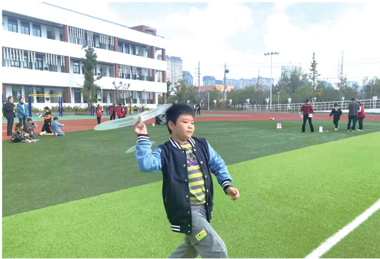
小选手正在比赛中。

盐城晚报讯 10月22日一大早,射阳县特殊教育学校和射阳县少年体育学校门口热闹非凡,前来参加今年第23届“飞向北京—飞向太空”全国青少年航空航天模型教育竞赛活动总决赛盐城射阳分区赛的同学们,正在有序入场。