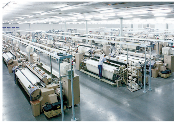
悦达家纺有限公司生产车间一角。嵇玉贵 摄

工程造价咨询、财务会计等行业前100位;先后获得“全国文明单位”“全国创先争优先进基层党组织”“全国建设工程造价先进单位”“全国招标投标协会行业先锋”等各级表彰300多次。 据了解,江苏现代低碳技术(盐城)研究院将于2022年11月18日举行揭牌仪式,分院成立后,将致力于双碳研究与咨询、能源互联网、低碳城市与建筑、低碳环境、大数据与数字孪生、碳金融与碳资产管理等服务。