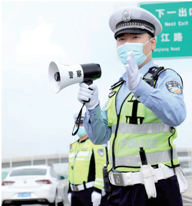
交警在城市快速路疏堵保畅。