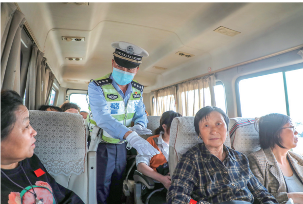
交警提醒大巴乘客规范系好安全带。