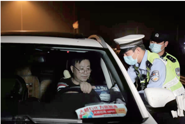
交警在高速入口提醒驾驶人注意夜间行车安全。