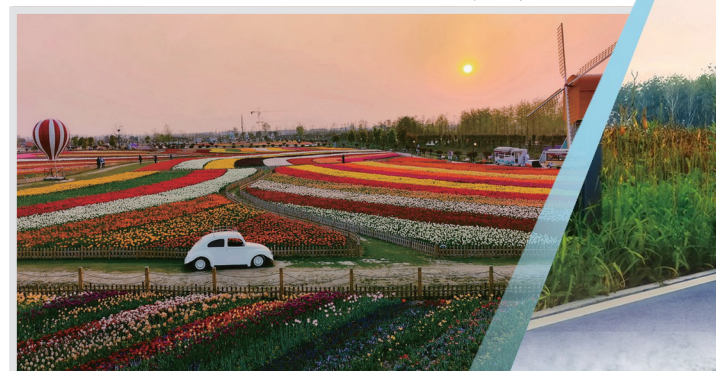
锦绣花田 摄于荷兰花海