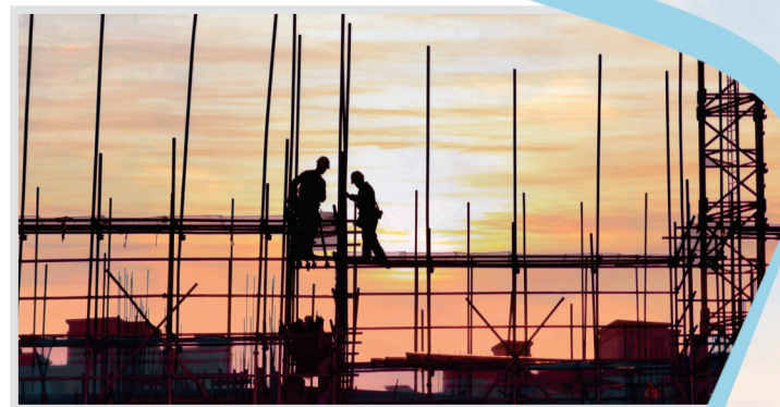
日出时分 摄于市区潮声路