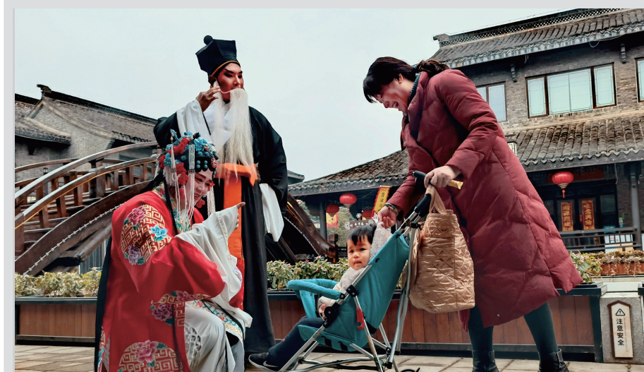
演出之前 摄于盐镇水街