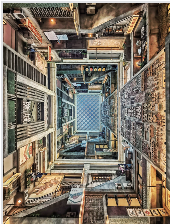
回味盐城 摄于竹林大饭店