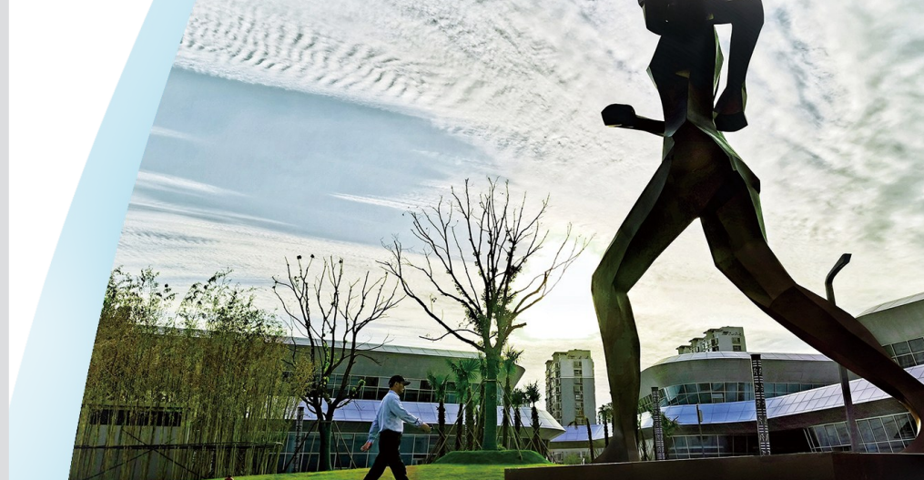
跨越 摄于盐龙体育公园