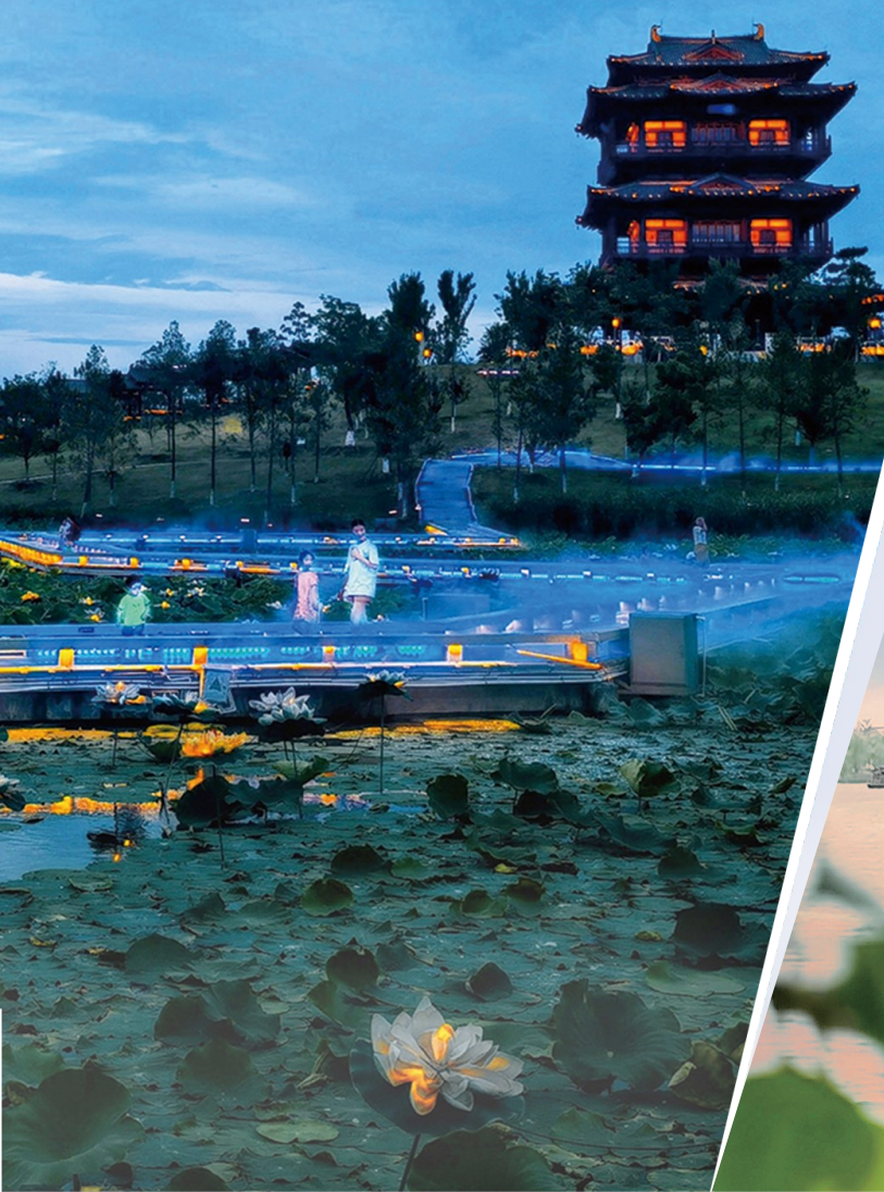
光影荷塘 摄于大洋湾生态运动公园