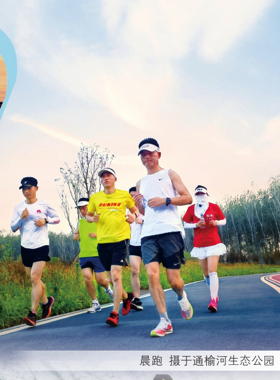
晨跑 摄于通榆河生态公园