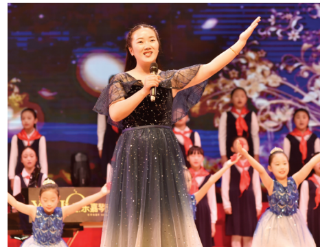
新河实验小学《同一首歌》

美妙的歌声化作深情的祝福,参赛师生们表示,这些歌曲首首饱含深情,句句直抵人心,引起大家的共鸣,催人奋进。本次活动进一步增强了师生们的爱国情怀,激励着盐城学子乘风破浪、勇往直前,努力成为有理想、有担当的新时代好少年。