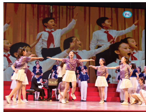
康居路初级中学《我是未来》