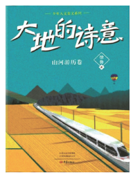
版本:大象出版社 作者:徐鲁 《大地的诗意:山河游历卷》