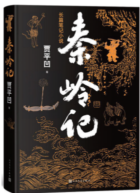
《秦岭记》作者:贾平凹 版本:人民文学出版社

中国的南北分界线是秦岭——淮河一线,此线的南面和北面,无论是自然条件、农业生产方式,还是地理风貌和人民的的生活习俗,都有明显的差异。秦岭对中国地理、文化等方面都有着特殊的意义,贾平凹在谈及秦岭时说:“一条龙脉,横亘在那里,提携了黄河长江,统领着北方南方。这就是秦岭,中国最伟大的山。”《秦岭记》就是一本关于秦岭的百科全书,有山川里隐藏着万物生灵,有河流里流淌着生命低语,更有万千沟坎褶皱里生动的物事、人事和史事。