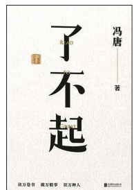
版本:北京联合出版公司 作者:冯唐 《了不起》