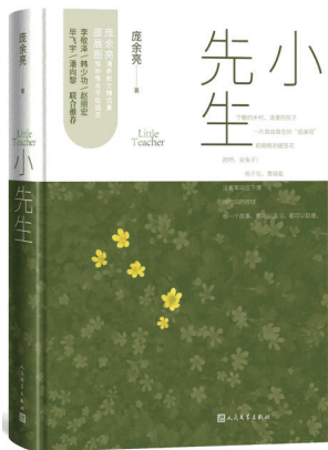
《小先生》 作者:庞余亮 版本:人民文学出版社